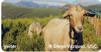
geiter © Diego Vazquez, USC